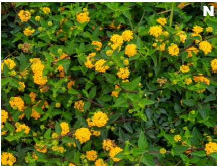
Lantana camara rastrera